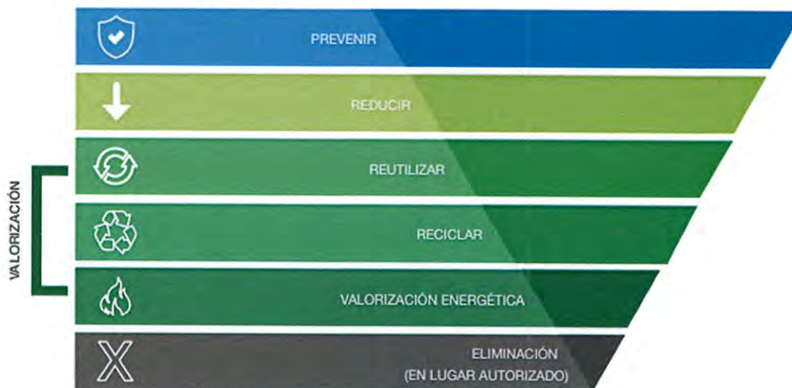
FIGURA 1. JERARQUÍA DE PIRÁMIDE INVERTIDA

TODAS LAS OBRAS FRIL 2023 EN ADELANTE DEBERÁN CONTAR CON UN PLAN DE GESTIÓN DE RCD (Residuos de Construcción y Demolición) Incorporar en Especificaciones Técnicas un plan de acción de residuos en obra, capacitaciones, aseo y segregación de materiales, almacenaje, valorización del residuo y destino del RCD.