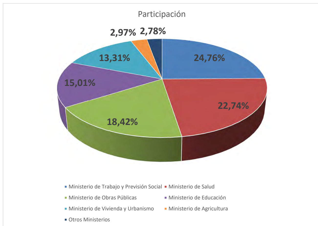
Gráfico 1. Participación segmentada por Ministerio.