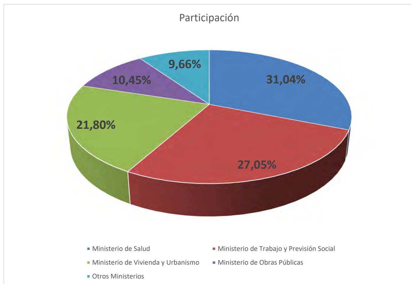
Gráfico 1. Participación segmentada por Ministerio.