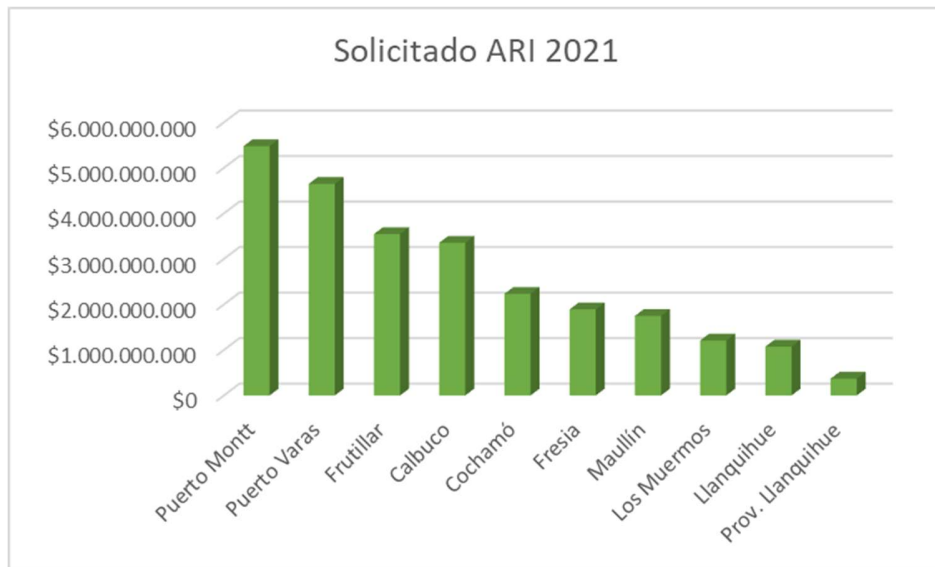
Gráfico 3. Gráfico ARI 2021 Provincia de Llanquihue correspondiente al Gobierno Regional.