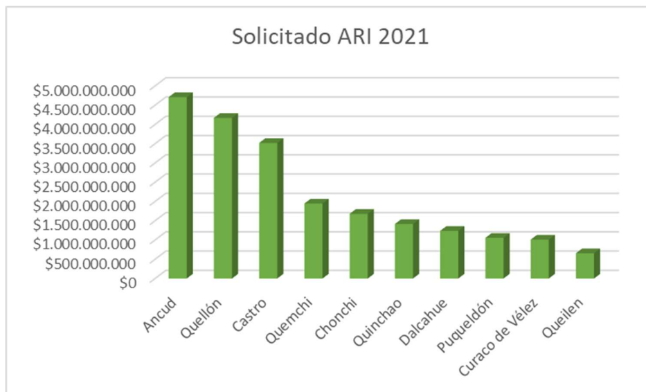
Gráfico 2. Gráfico ARI 2021 Provincia de Chiloé correspondiente al Gobierno Regional.