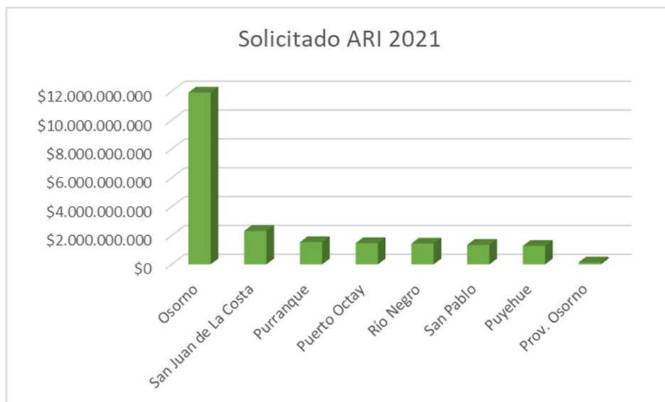
Gráfico 4. Gráfico ARI 2021 Provincia de Osorno correspondiente al Gobierno Regional.