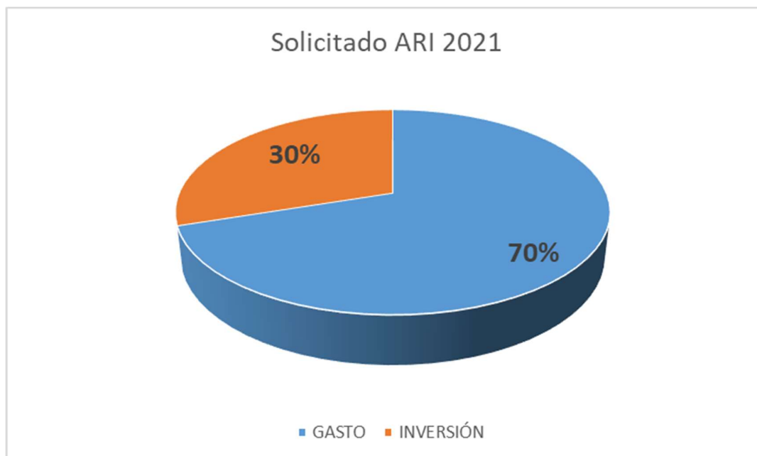
Gráfico 7. Gasto e Inversión Pública ARI 2021.