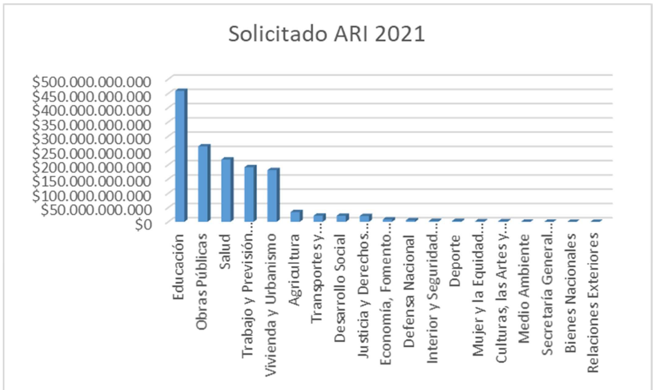
Gráfico 6. ARI 2021 Según Ministerios con excepción del Gobierno Regional.