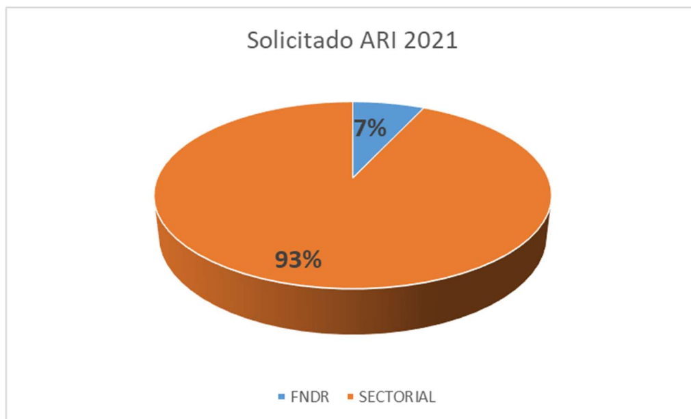
Gráfico 8. Porcentaje del Gasto e Inversión Pública.